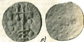
Рис. 2 Подражания византийским милиарисиям Василия II и Константина VIII: а — серебряно; б, в — биллоз; г — е — медь