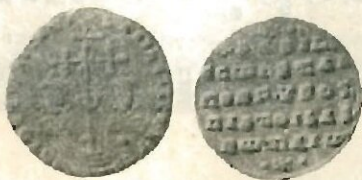
Рис. 1 Византийский милиарисий Василия II и Константина VIII

В музейных собраниях мы находим группу медных (реже серебряных) подражаний явно общего происхождения. За редким исключением все они копируют один оригинал (рис. 1) — византийские серебряные монеты (милиарисии) времени совместного правления Василия II и Константина VIII (976—1025 гг.) 1) . На лицевой стороне